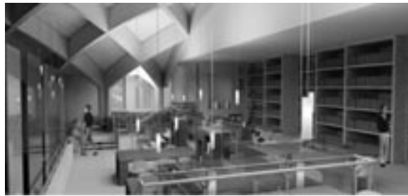
maquette de Cimaise architectes

Nous avons déjà identifié des individus parmi les Anciennes et Anciens ainsi que des corporations avec des valeurs philanthropiques qui souhaiteraient se joindre à ce projet unique où l'histoire sera jumelée avec les dernières technologies de pointe.