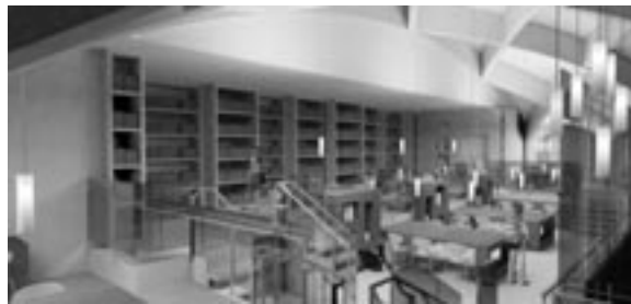
maquette de Cimaise architectes