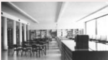
Service des archives du Séminaire de Sherbrooke (SPA2601.003)